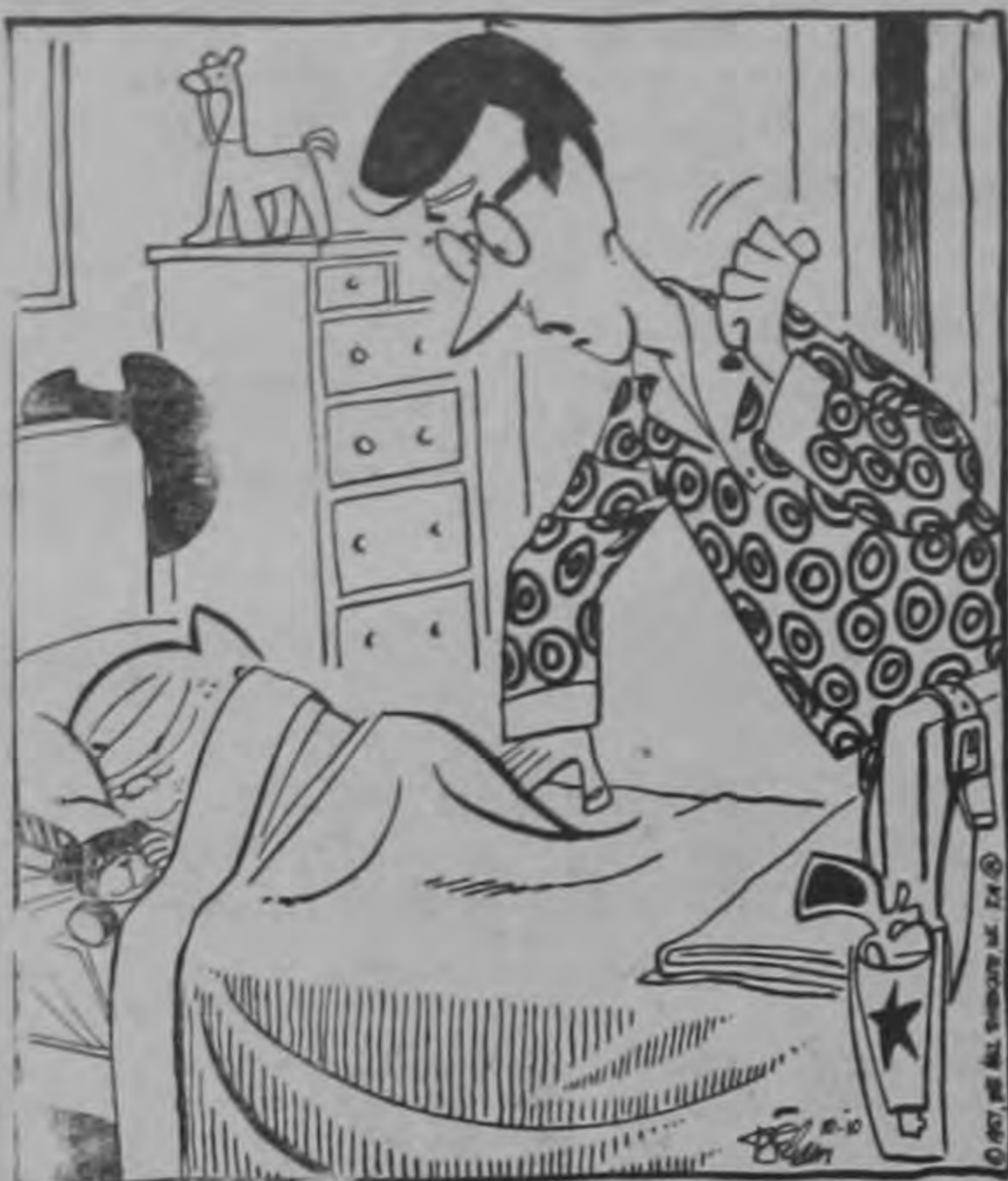
—Yo sé que no estás dormido... El aparato de la visión está aun caliente...