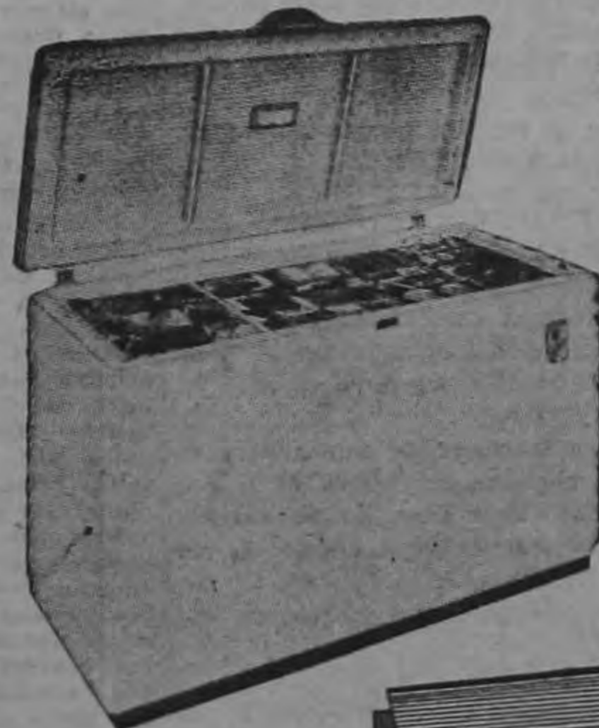
Congelador GIBSON 17 pies cúbicos

Contado .. ₡ 3.490.00 Prima .. 432.75 SEMANAL .. 37.95 Hay otros modelos.