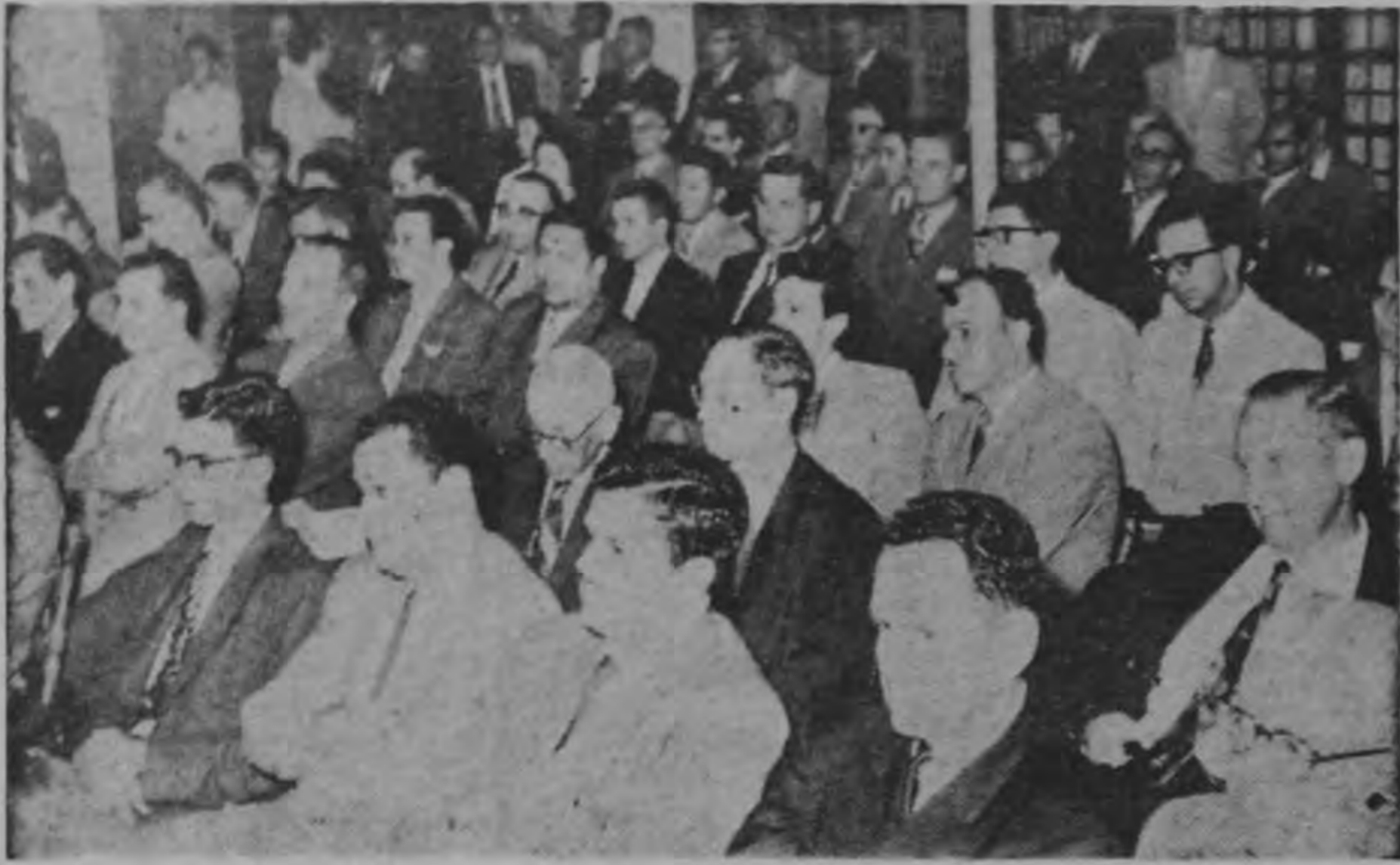
Vista parcial de la numerosa concurrencia que en la noche de ayer asistió al acto inaugural en la celebración del Centenario del Colegio de Abogados de Costa Rica. Distinguidos profesionales, escuchan atentamente a los oradores que se referían a la simbólica fecha que en esta semana conmemoran los abogados nacionales.

El Colegio de Abogados de Costa Rica inició ayer la serie de actos para celebrar el Centenario de su fundación.