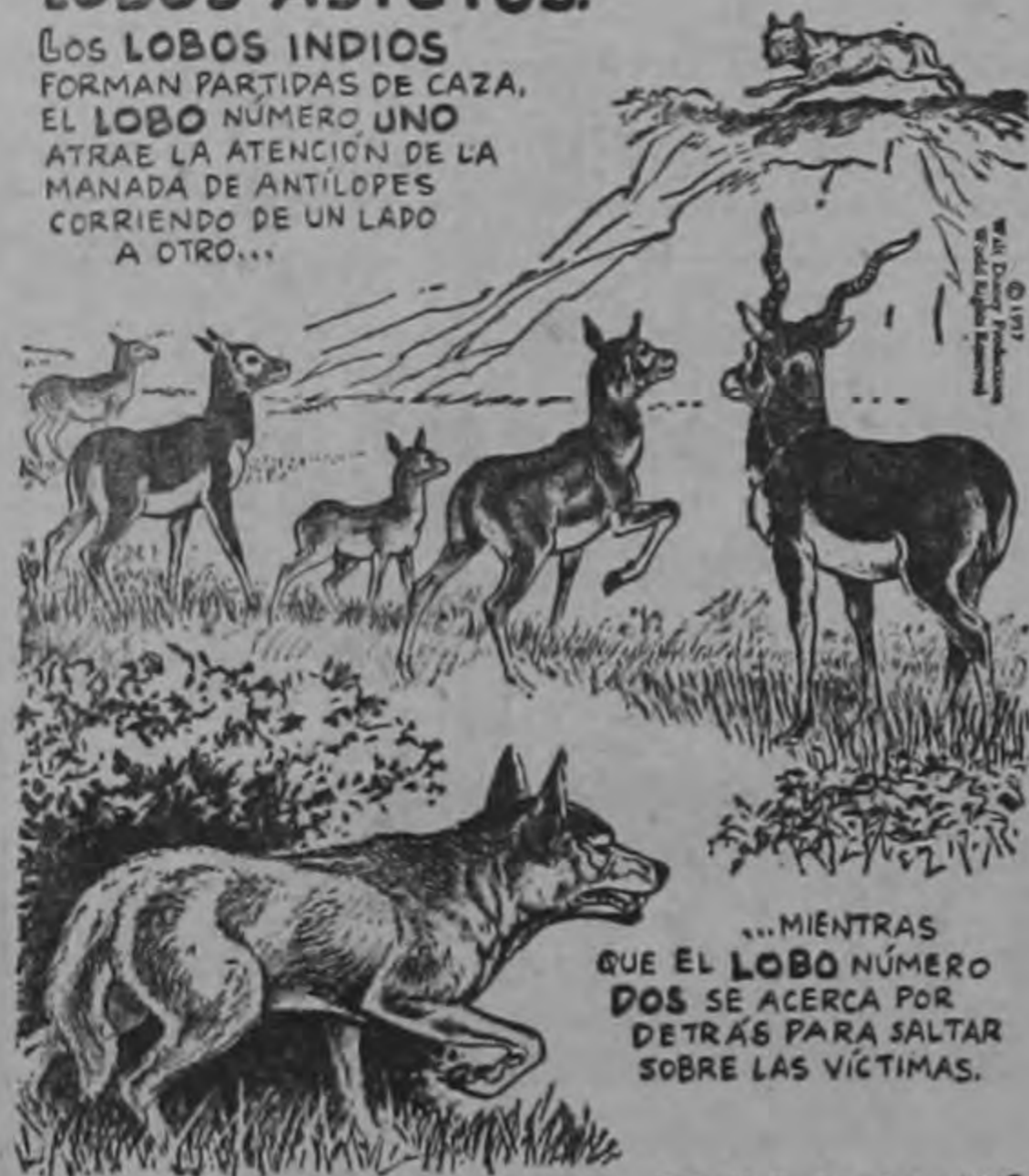
...MIENTRAS QUE EL LOBO NÚMERO DOS SE ACERCA POR DETRÁS PARA SALTAR SOBRE LAS VÍCTIMAS.