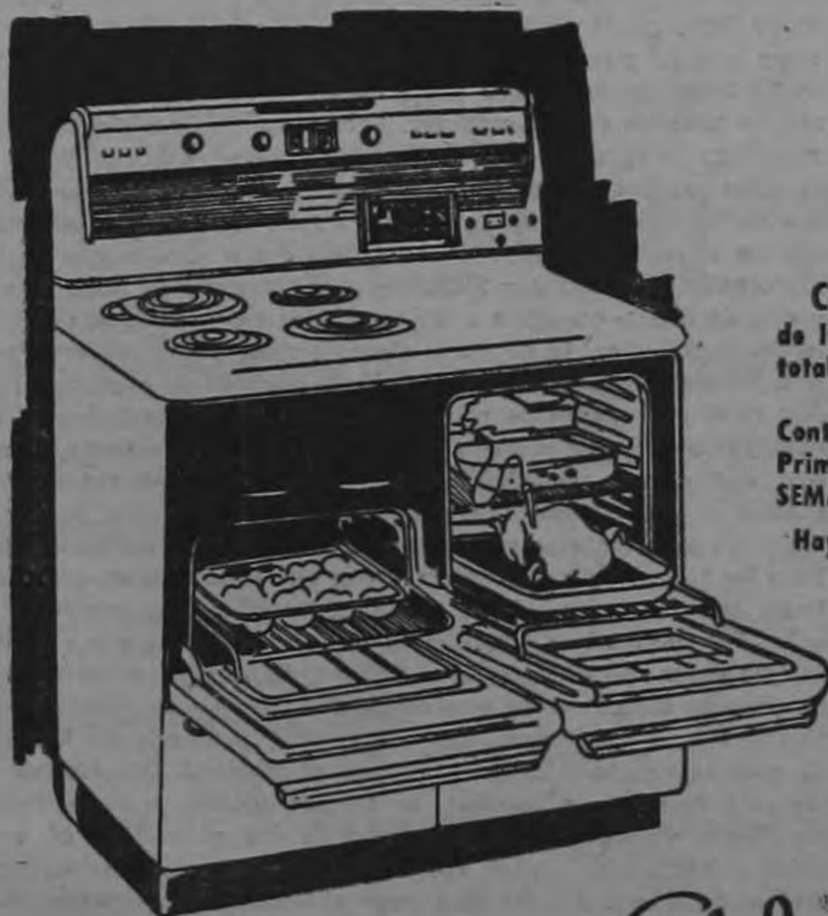
Cocina GIBSON de lujo — de 2 hornos totalmente automática

GP-104-C. — 10 1/2 pies de lujo y con deshielo automático. Contado .. .. ₡ 3.292.85 Prima .. .. 408.30 SEMANAL .. .. 35.25 Hay muchos otros modelos.