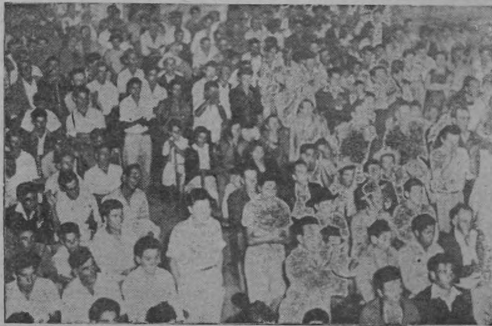
Entusiasmo y fe en la victoria hubo en el acto del domingo en El Tejar de El Guarco.