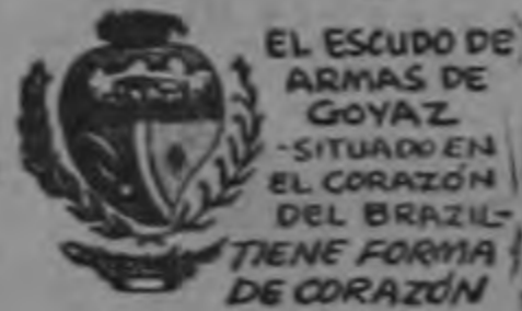
EL ESCUDO DE ARMAS DE GOYAZ—SITUADO EN EL CORAZÓN DEL BRAZIL—TIENE FORMA DE CORAZÓN

LA IGLESIA DE S. KOLOMAN—Füssen, Alemania VENERA A UN PEREGRINO QUE EN 1012 FUE AHORCADO COMO ESPÍA. LOS FELIGRESES SE CONVENCIONERON DE LA INOCENCIA DEL PEREGRINO, DESPUÉS QUE SU CUERPO PERMANECIÓ COLGADO EN LA HORCA DURANTE UN AÑO ¡SIN DESCOMPONERSE!