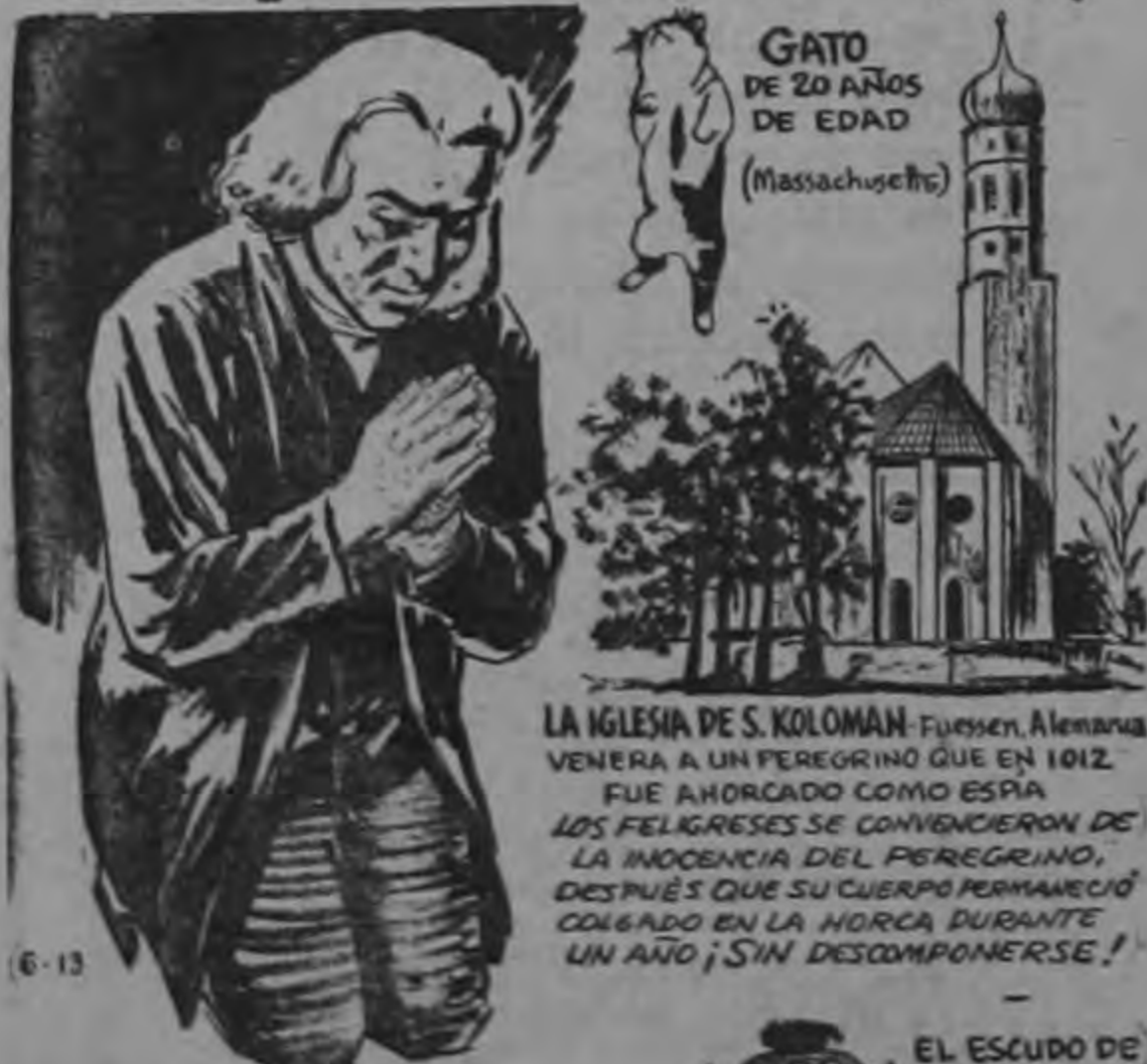
GATO DE 20 AÑOS DE EDAD (Massachusetts)

LA IGLESIA DE S. KOLOMAN—Füssen, Alemania VENERA A UN PEREGRINO QUE EN 1012 FUE AHORCADO COMO ESPÍA. LOS FELIGRESES SE CONVENCIONERON DE LA INOCENCIA DEL PEREGRINO, DESPUÉS QUE SU CUERPO PERMANECIÓ COLGADO EN LA HORCA DURANTE UN AÑO ¡SIN DESCOMPONERSE!